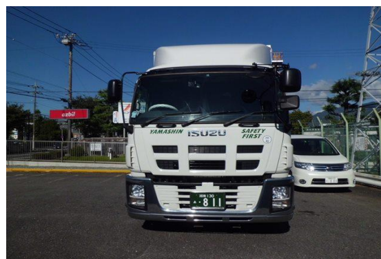
平成27年排出ガス基準(ポスト新長期規制適合車)